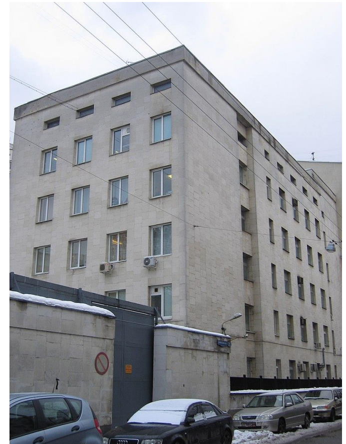
Serbského institut v Moskvě